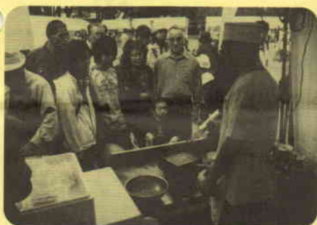
玉子焼き実演 (横浜市寿司商組合)