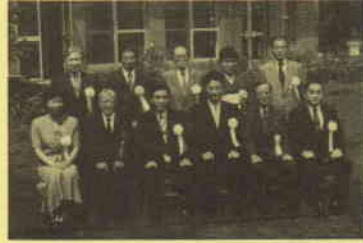
横浜マイスター 称号授与式記念写真