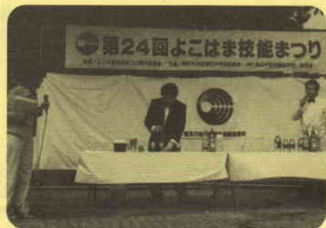
カクテルづくり (横浜市社交飲食喫茶業連合会)