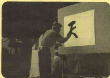
文字書き(看板)の実演 (横浜市屋外広告美術協同組合)