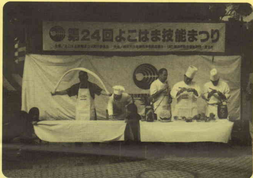
手打ち麺の実演 (神奈川県中日調理師会)