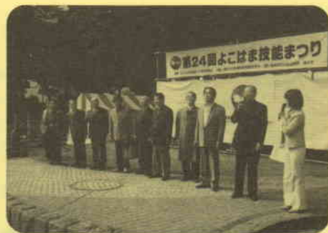
自作自演のファッションショー (神奈川県洋服商工業協同組合)