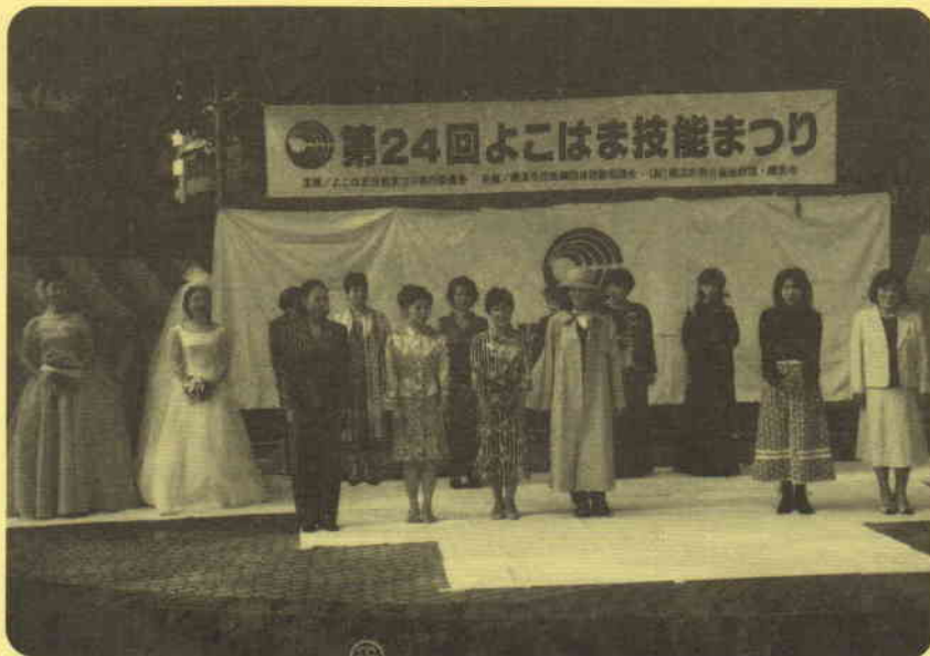
創作ファッションショー (神奈川県洋装組合連合会)