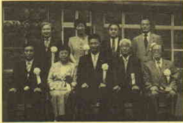
育成団体選定証授与式記念写真