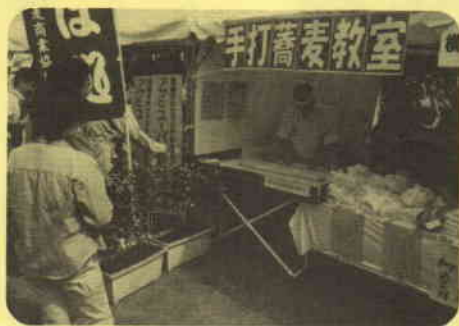
手打ちそば実演 (横浜蕎麦商業協同組合)