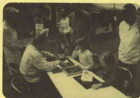
銅板画づくり (横浜市板金組合連合会)