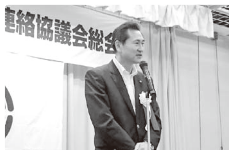
牧野経済局長来賓挨拶