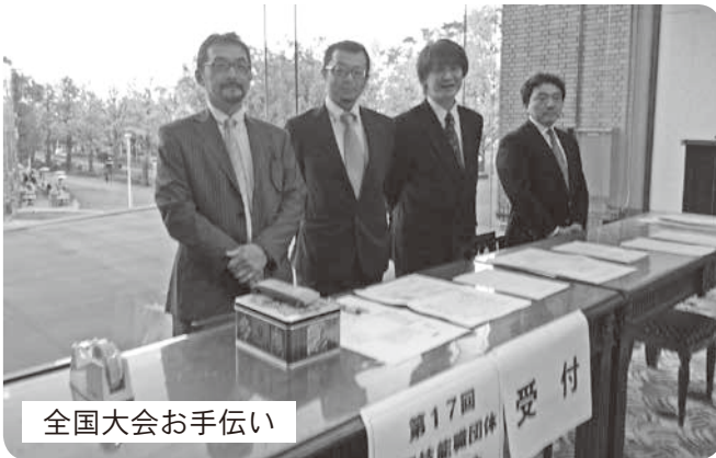
全国大会お手伝い