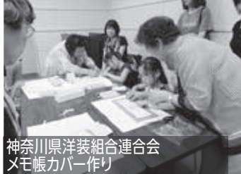
神奈川県洋装組合連合会 メモ帳カバー作り

毎年大好評の「匠の小学校」は今年3回目となり、8月23日(日)横浜市技能文化会館全館を使用して開催され、多くの親子が来館しました。事前予約の抽選も高倍率となり、キャンセル待ちの方も多く来館されましたが、混雑もなく各イベントコーナーで順調に体験を楽しんでいました。今回は技連協会員団体13団体が参加し、体験者736名、保護者を合わせた来場者は昨年と同じ約1600名で盛況でした。