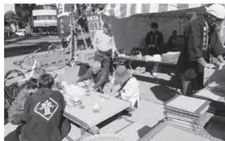
ミニゴザ製作体験