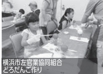
横浜市左官業協同組合 どろだんご作り