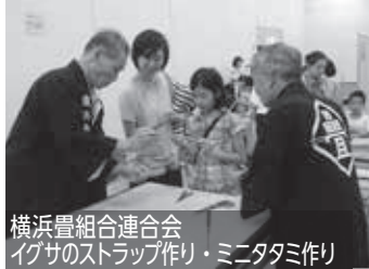
横浜畳組合連合会 イグサのストラップ作り・ミニタタミ作り