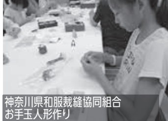
神奈川県和服裁縫協同組合 お手玉人形作り