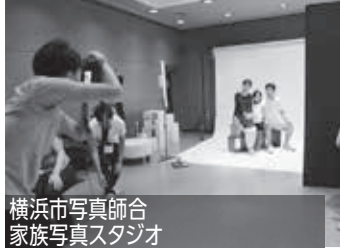
横浜市写真師会 家族写真スタジオ