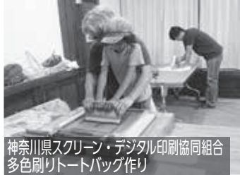
神奈川県スクリーン・デジタル印刷協同組合 多色刷りトートバッグ作り