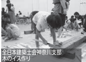
全日本建築士会神奈川支部 木のアイス作り