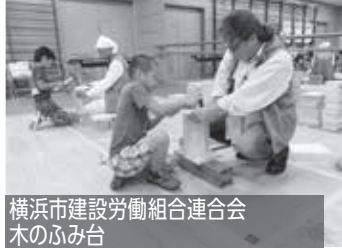
横浜市建設労働組合連合会 木のふみ台