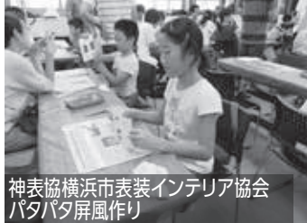
神表協横浜市表装インテリア協会 パタパタ屏風作り