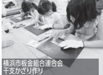
横浜市板金組合連合会 干支かざり作り