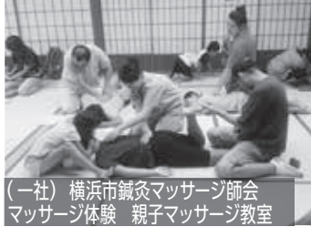
(一社)横浜市鍼灸マッサージ師会 マッサージ体験 親子マッサージ教室