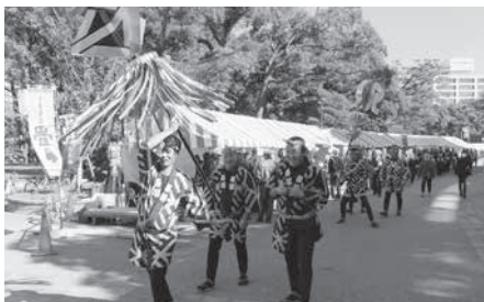
まとい振り込み、木遣り披露