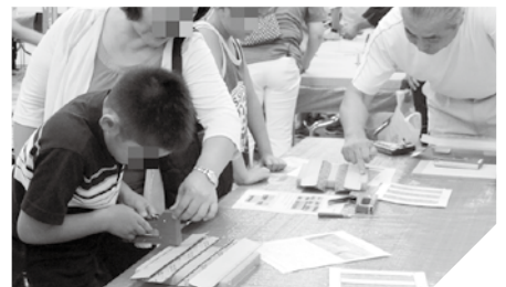
神奈川県スクリーン・デジタル印刷協同組合 ◆多色刷りトートバッグ作り