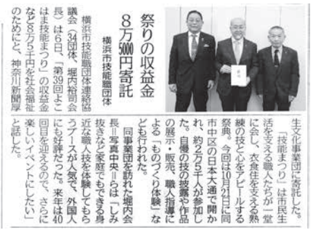
▲11/7 付神奈川新聞記事掲載

なお、収益金の一部85,000円を社会福祉のため、11月6日に会長、副会長、会計理事が神奈川新聞厚生文化事業団に持参し、寄付いたしました。