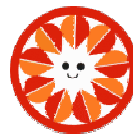
クリちゃんマーク

また、組合加盟店では、親切・丁寧・安心をモットーに信頼あるクリーニング店を目指しています。地域の消費者の皆様にも密着した衣類の良きアドバイザーとして、これから、ますます大切な役目を果たさなくてはならないと思っています。