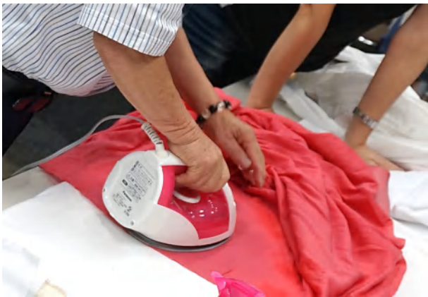
アイロンかけに苦労している洋服も体験