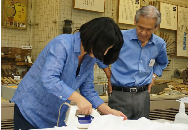
Yシャツのかけ方を丁寧に指導