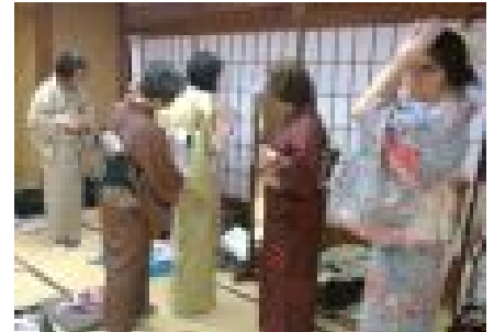
きもの教室の様子

一級着付け技能士として、みやうち着物学院で講師を務められる他、 着付士の技術向上を図るため、着付士に対する指導・育成も行っています。