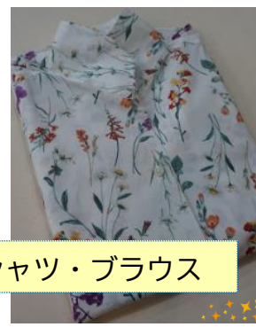
受講生の仕上げたシャツ・ブラウス