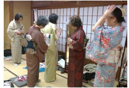
きもの教室の様子

一級着付け技能士として、みやうち着物学院で講師を務められる他、着付士の技術向上を図るため、着付士に対する指導・育成も行っています。