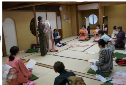
当館での「きもの教室」の様子

一級着付け技能士として、みやうち着物学院で講師を務められる他、着付士の技術向上を図るため、着付士に対する指導・育成も行っています。